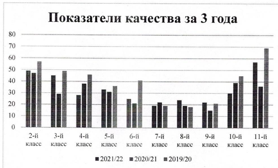
Табл. 3. Динамика качества знаний за 3 года

Вывод: наблюдается положительная динамика качества обученности по школе в 2022 году по сравнению с 2021, но результат 2020 года ещё не достигнут.